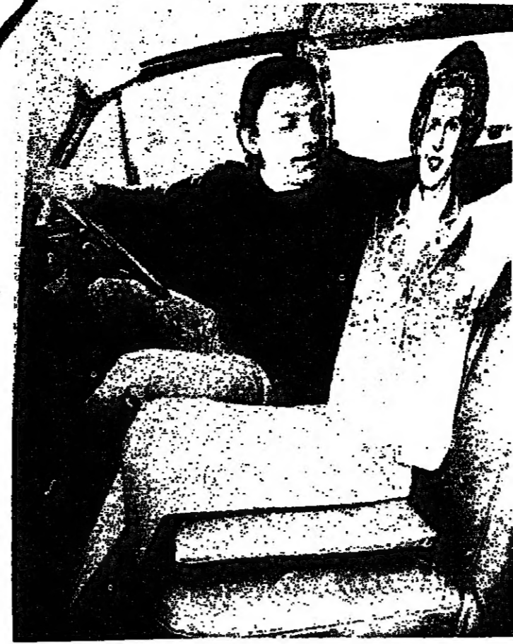
مارغريت تاتشر .. من ورق !

والغش منافي للخلق الكريم ، ضار بالآخرين ، رافع للفتنة بين الناس ، بالإضافة الى ان ثورته هي كسب بلا جهد ولا عمل مشروع ، والتعاطف الاسلامي الشريفة ، يوجب كسب بلا جفاء ، ويدخل في اكل اموال الناس بالباطل التظنفي في المكيل والميزان